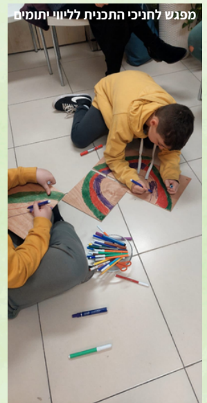
מפגש לחניכי התכנית לליוי יתומים