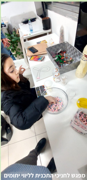
מפגש לחניכי התכנית לליוי יתומים