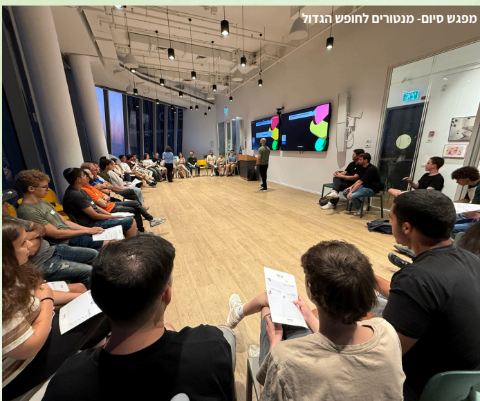
מפגש סיום- מנטורים לחופש הגדול