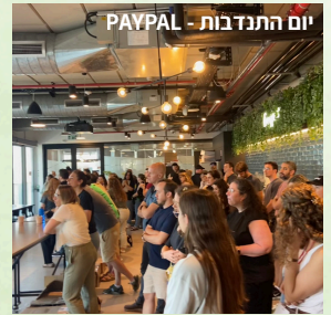
יום התנדבות - PAYPAL