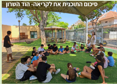
סיכום התוכנית אח לקריאה- הוד השרון